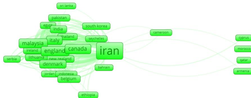
تصویر ۳. شبکه هم‌تالیفی کشور ایران با سایر کشورها در تولیدات علمی پژوهشگران ایرانی حوزه مدیریت دانش